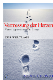
Vermessung der Herzen Verse, Essays, Aphorismen Zur Weltlage Ca 80 Seiten (19,90 Euro)