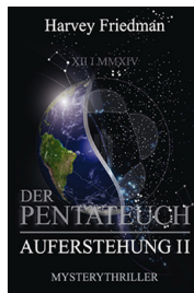
Der PENTATEUCH Auferstehung 2 ISBN 978-3-9814888-1-4 Ca. 370 Seiten (24,90 Euro)