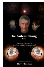
Die AUERSTEHUNG Die Rückkehr (Urfassung) ISBN 978-3-9814888-8-2 Ca 560 Seiten (149,00 Euro)