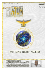
Das PHAnTOM The last voice of mankind A4, hochglanz, farbig 80 Seiten (24,90 Euro)