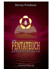
Der PENTATEUCH Auferstehung 7 ISBN 978-3-9814888-7-5 Ca. 550 Seiten (29,90 Euro)