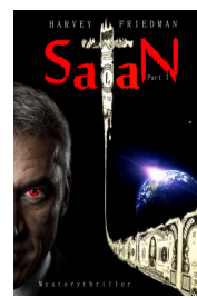
SATAN Episode 1 ISBN 978-3-9814888-5-4 Ca. 300 Seiten (19,90 Euro)