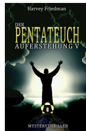
Der PENTATEUCH Auferstehung 5 ISBN 978-3-9814888-4-5 Ca. 520 Seiten (24,90 Euro)