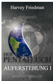
Der PENTATEUCH Auferstehung 1 ISBN 978-3-9814888-0-7 Ca. 420 Seiten (24,90 Euro)