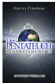
Der PENTATEUCH Auferstehung 3 ISBN 978-3-9814888-2-1 Ca. 560 Seiten (24,90 Euro)