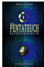
Der PENTATEUCH Auferstehung 4 ISBN 978-3-9814888-3-8 Ca. 530 Seiten (24,90 Euro)