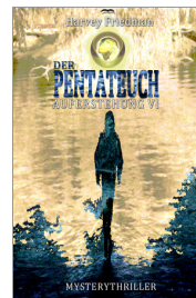
Der PENTATEUCH Auferstehung 6 ISBN 978-3-9814888-6-2 Ca. 550 Seiten (29,90 Euro)