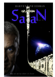
SATAN Episode 2 ISBN 978-3-9814888-9-3 Ca. 320 Seiten (19,90 Euro)